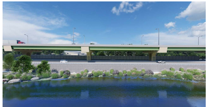
Representación conceptual preliminar de la extensión de la autopista SR 414 y Maitland Boulevard desde el mirador del lago Bosse. Sujeto a cambios.