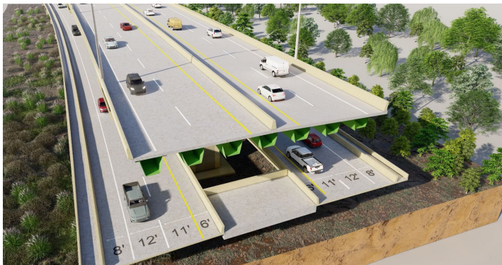
Representación conceptual preliminar de una sección típica del corredor. Sujeto a cambios.